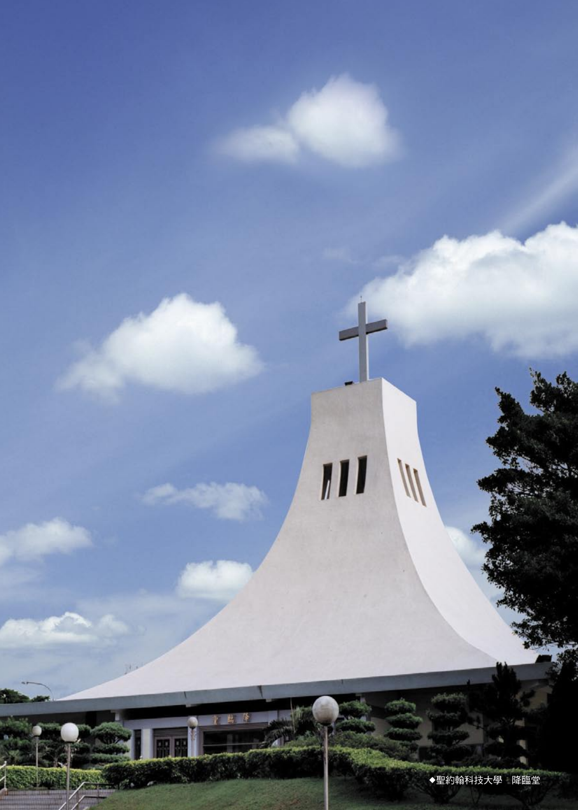
◆聖約翰科技大學 降臨堂