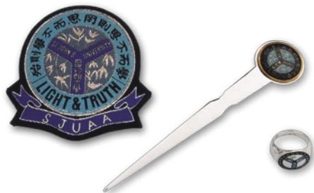
◆上海聖約翰大學的校徽、戒指、裁紙刀