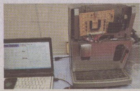
←亞東技術學院研發「心情與經驗導向的咖啡調製系統」。