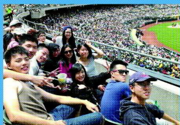
在巨人隊主場看舊金山巨人隊 vs. 運動家隊大賽。