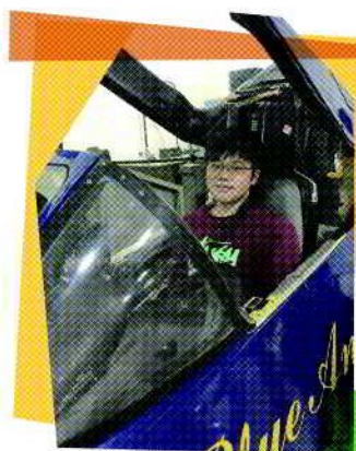
坐進戰鬥機駕駛艙。