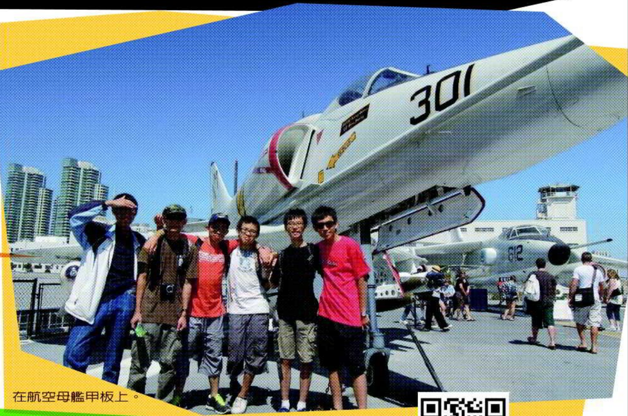
在航空母艦甲板上。