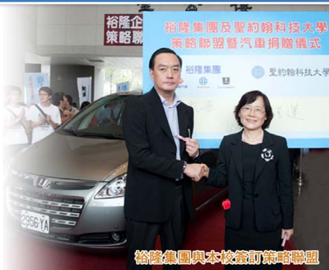
裕隆集團與本校簽訂策略聯盟

聖約翰科技大學推動全校性實習輔導機制，以保障學校、學生與企業三方面之權益；並透過企業實習引導，以有效提升學生專業能力與實際職場訓練，合作實習企業有鍊德科技、聯興國際、萬聯國際、家福股份有限公司、台北市商業處等共65家，今年更與裕隆集團企業70餘家進行建教合作與就業實習，並請業界專家親自傳授學生業界經驗，例如國際商務系至京華城舉辦「國際商品發表暨創意展售會」。