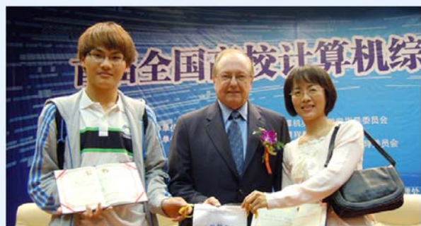
資管系榮獲「IC3電腦綜合應用能力大賽海峽兩岸賽」網路應用組第一名