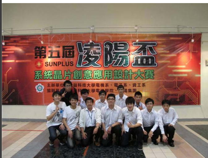
第五屆凌陽盃系統晶片創意應用設計大賽