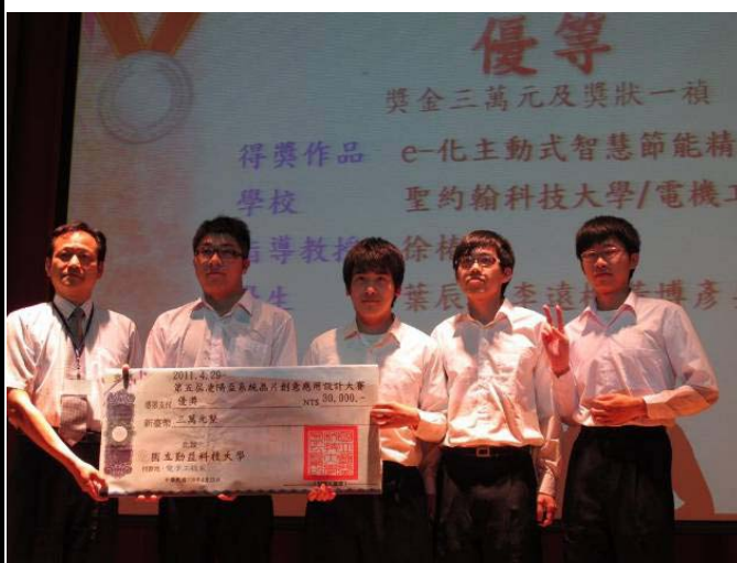
榮獲大專組 第二名(優等獎)