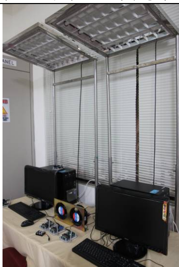
以異質網路建構主動式智慧節能系統