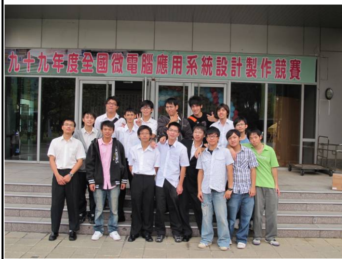
99年度全國微電腦應用系統設計製作競賽