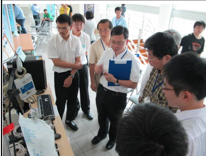
以嵌入式系統實現醫院病房自動化管理控制系統