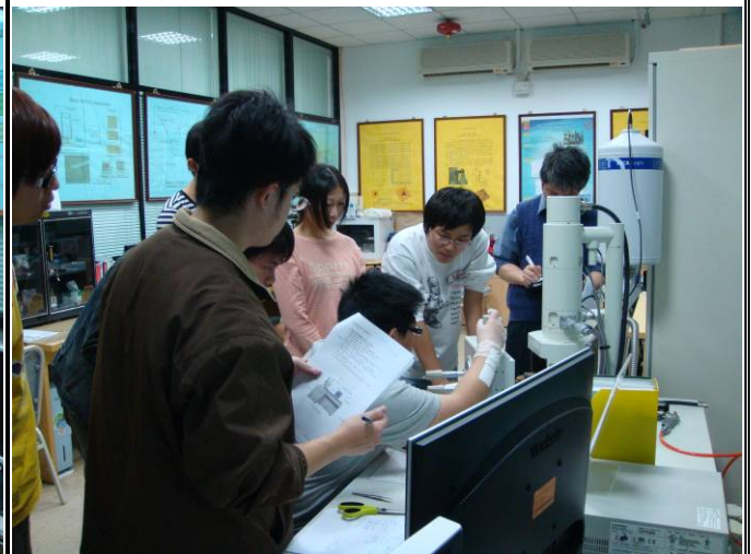
SEM人機控制介面解說