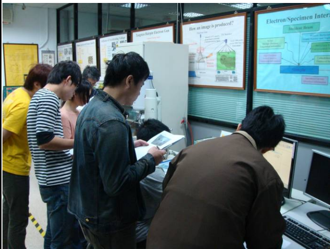
SEM工作原理及操作應用介紹