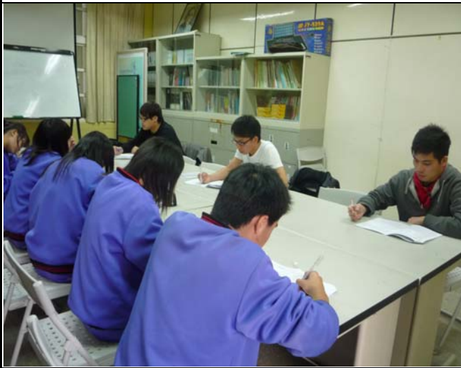
英語志工上課情形