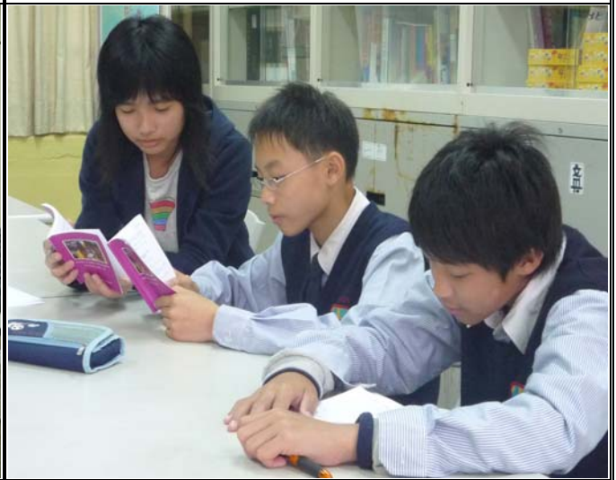
一對二輔導兼顧到學生個別差異