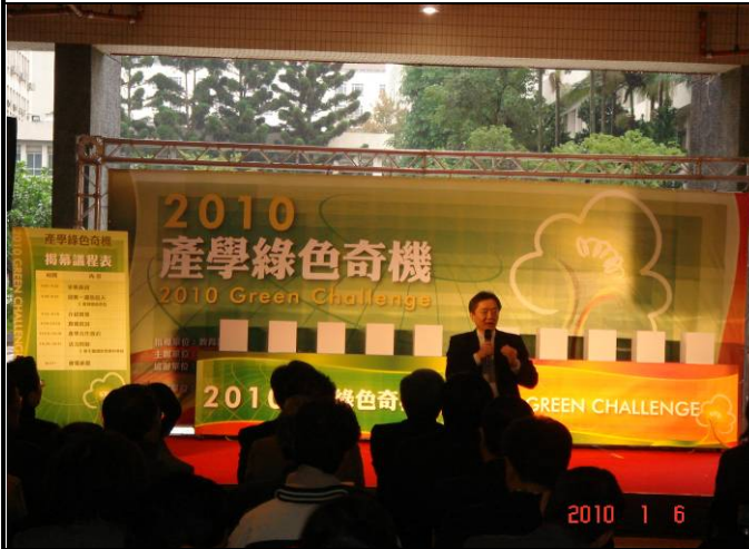
「2010產學綠色奇機」開幕