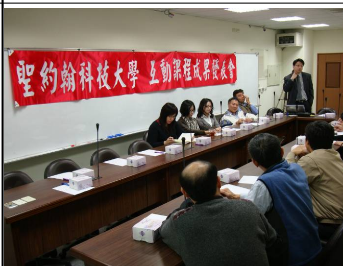
互動課程成果發表會