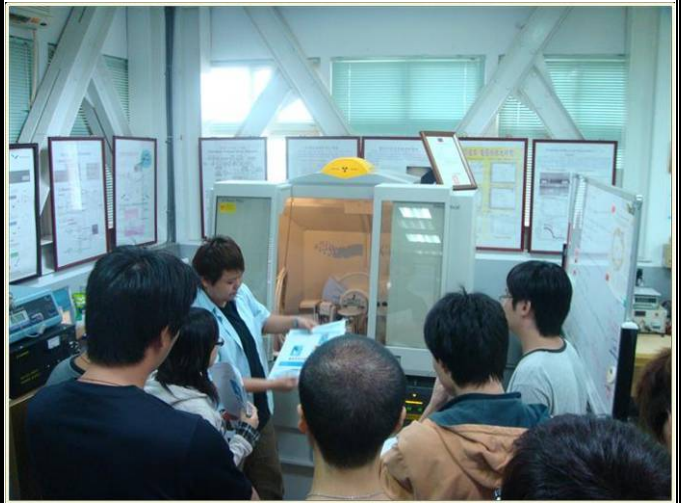
X光繞射儀相關模組介紹