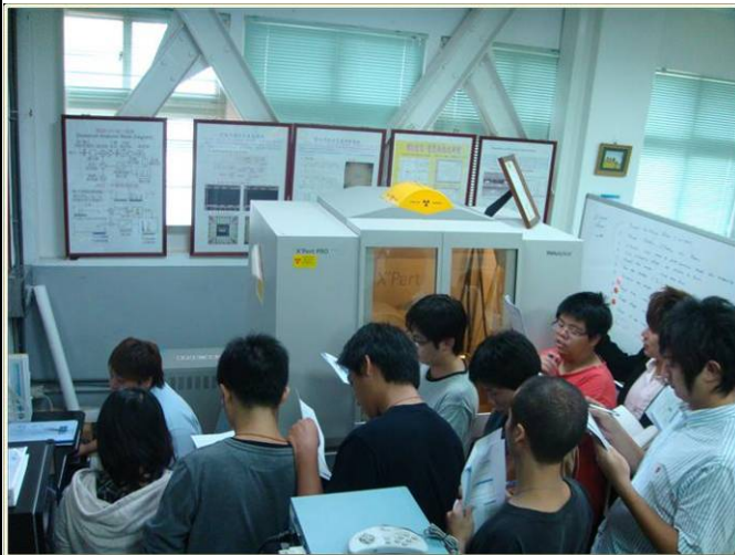
X光繞射儀操作說明