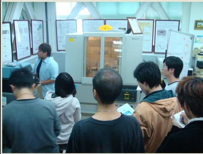
X光繞射儀原理及應用介紹