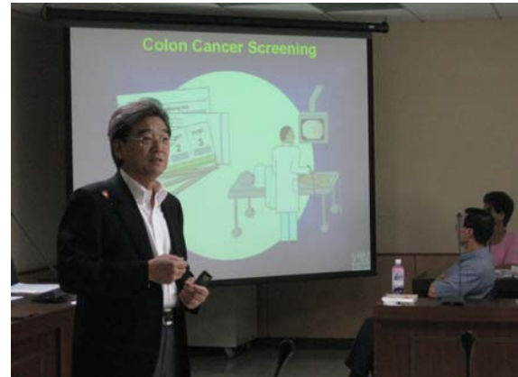
于教授說明有關癌症如何察覺與診斷