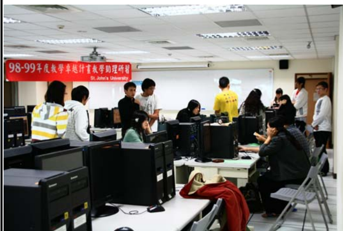
同學相互觀摩以及交流