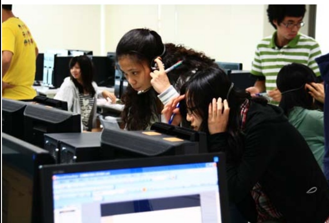
淑萍老師與學生之間的互動教學情形