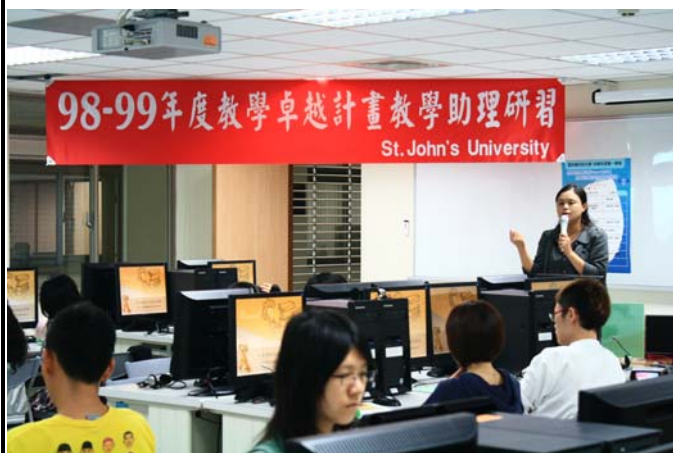
課程前的解說情形