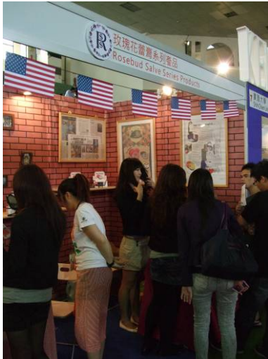
玫瑰花蕾膏展場照片