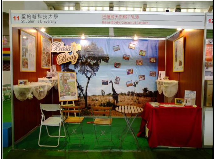
巴薩天然椰子乳液展場照片