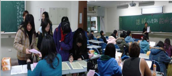
課輔制度說明與培訓