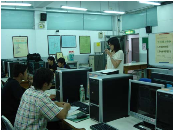
生涯測驗及效率學習量表線上檢測