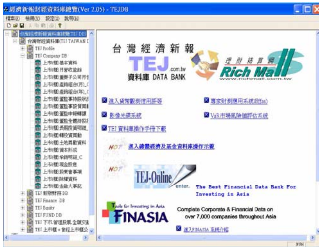
增加資料庫共計8種