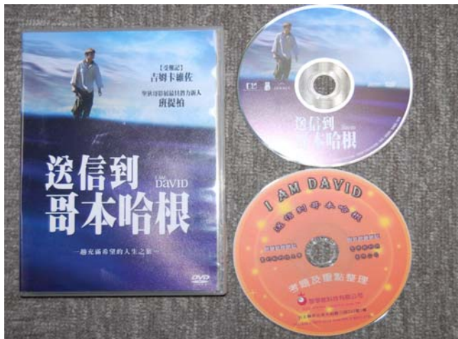
增加語言學習型視聽資料199件