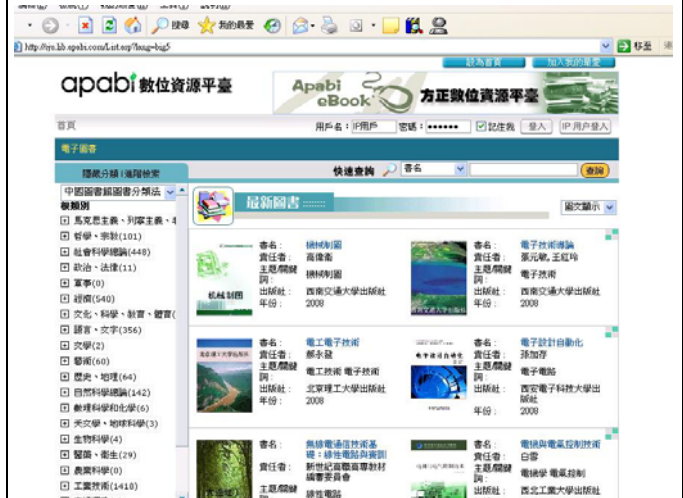
增加中文電子書1967冊