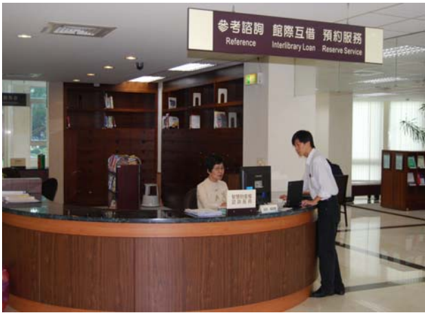
個別化資源利用講習