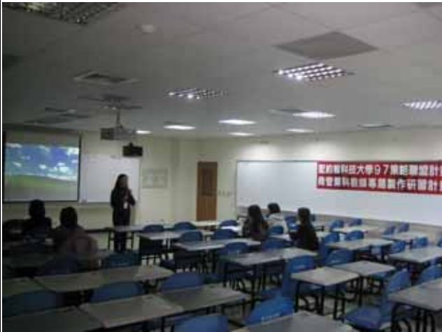
97. 12. 20上課情形—統計軟體介紹