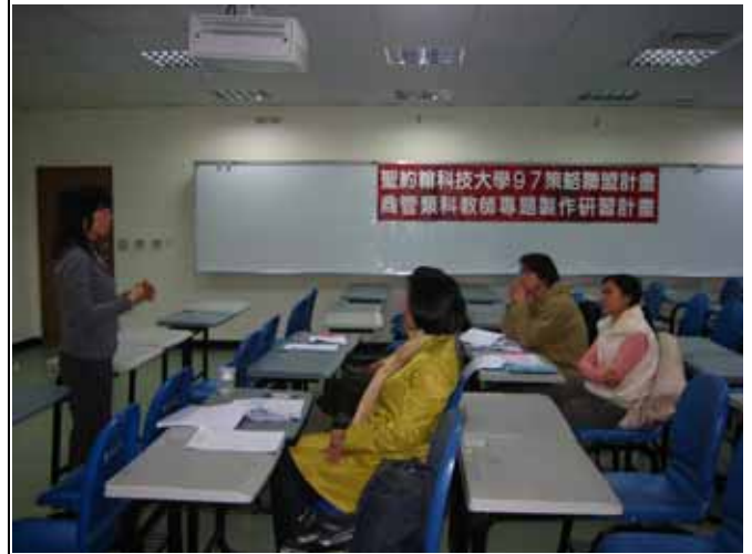
97. 12. 13上課情形-內容分析法介紹