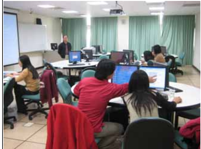
98. 01. 03上課情形—金融商品介紹