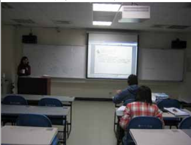
98. 12. 20大合照