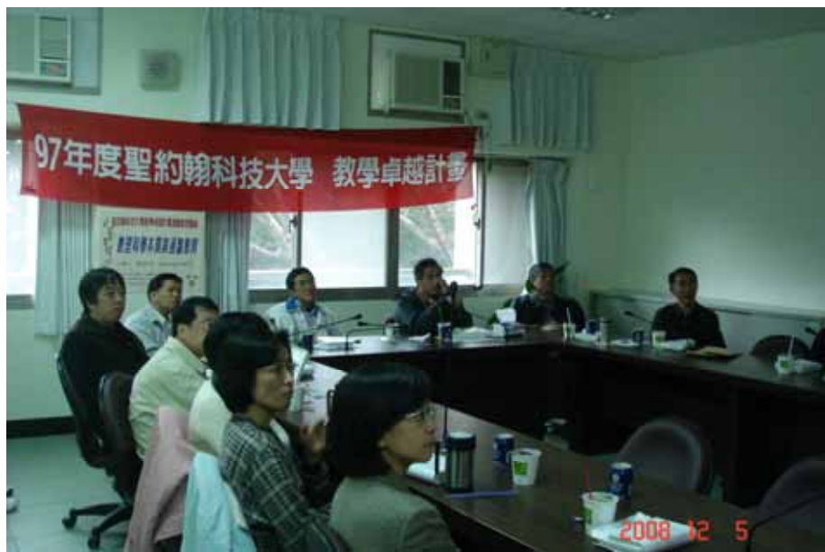
圖表 6 與會老師專心聆聽