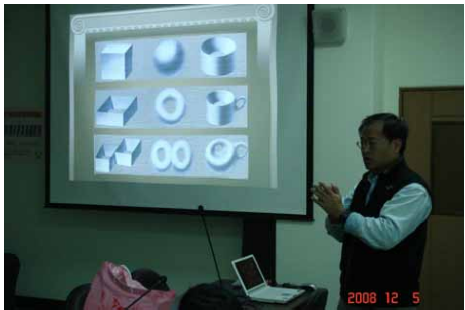
圖表 8 劉柏宏教授分享『甚麼是數學與科學素養』？