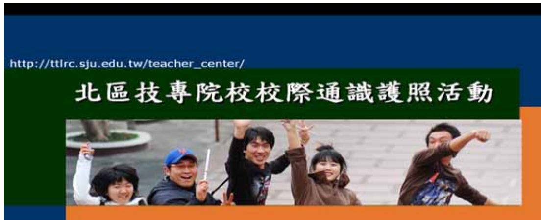
圖表 1 通識護照宣傳活動照片