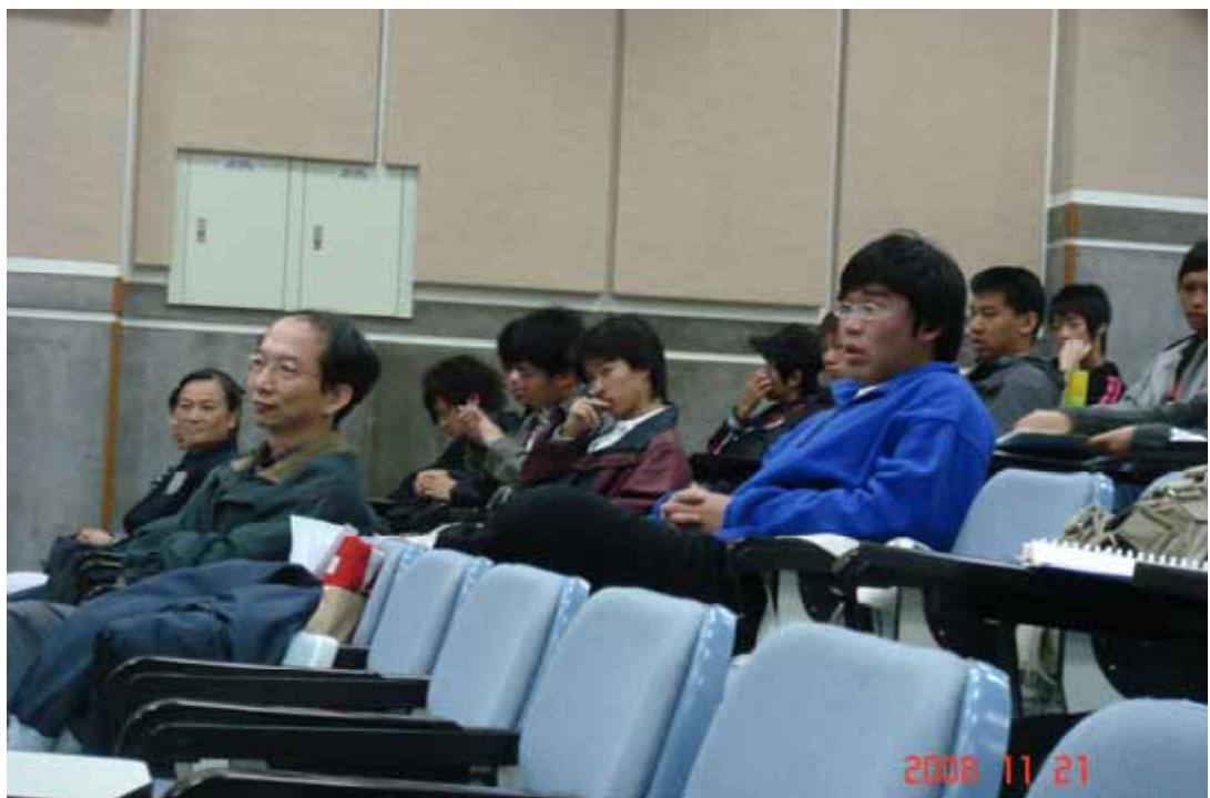
圖表 6 參與會場學生及聽眾認真聽講（沒有打瞌睡喔！）