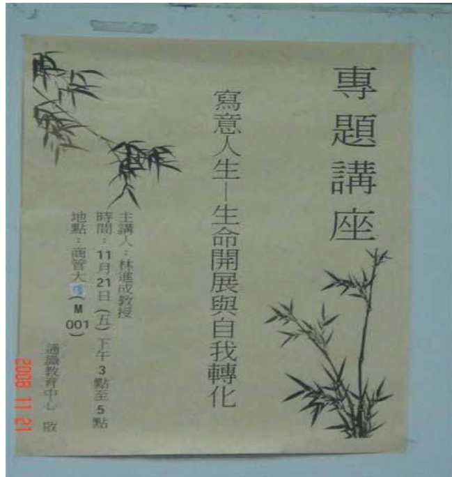
圖表 3 專題講座：寫意人生---生命開展與自我轉化（活動宣傳海報）