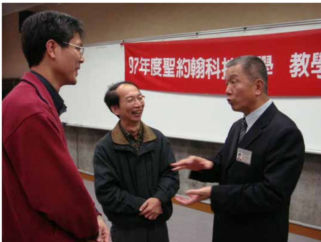
圖表 12 林進成教授會後與通識中心主任及老師們互動情形