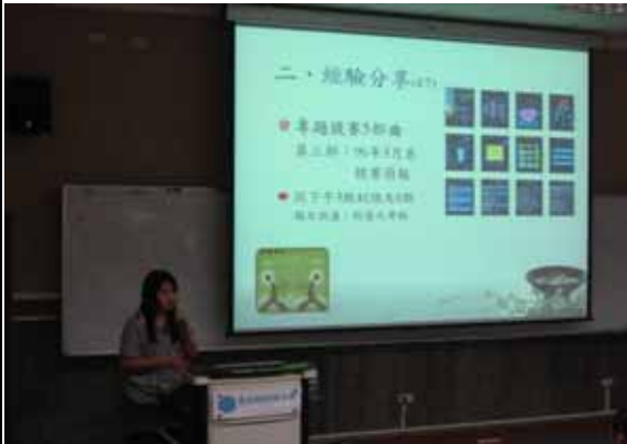
邀請畢業的學姐們回校分享參加雲科大競賽之心路歷程（2）