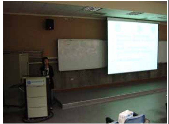
邀請財金系畢業校友回校分享銀行業甘苦談