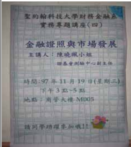
實務專題講座（四）海報訊息