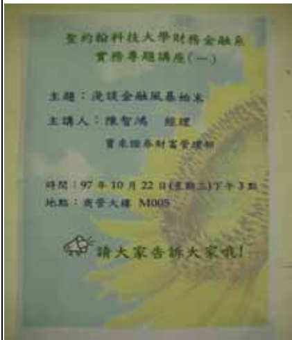
實務專題講座（一）海報訊息