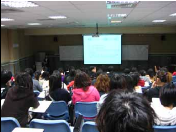
學姐回校分享銀行業甘苦談(二)