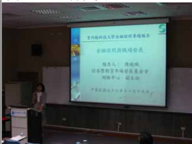
師詳細金融證照與市場現況