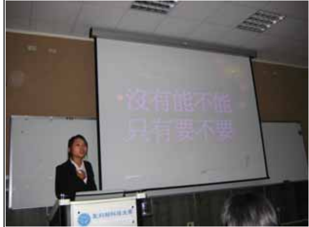
邀請畢業的學姐們回校分享參加雲科大競賽之心路歷程（1）