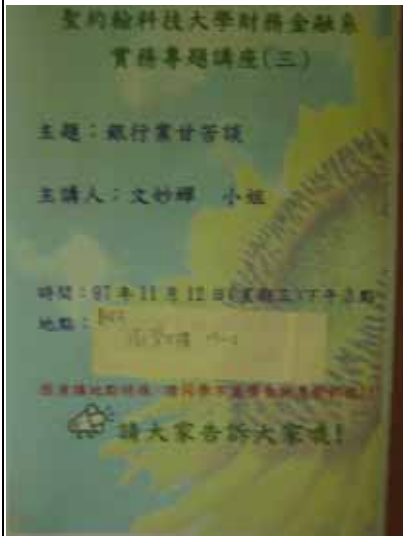
實務專題講座（三）海報訊息