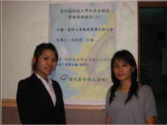
實務專題講座（二）海報訊息及主講學姐合影