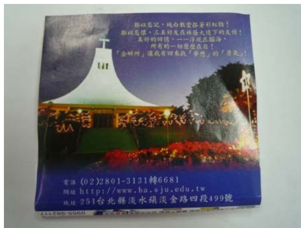
文宣品一面紙（背面）