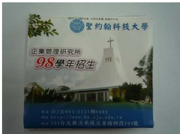
文宣品一面紙（正面）