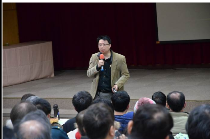
傑出教師教學經驗分享