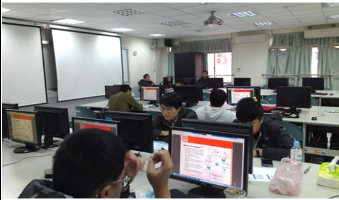
活動照片：上課情形