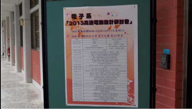
2013高速電路設計研討會議程海報