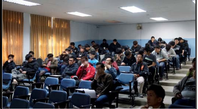
學生及老師們正專注聽演講