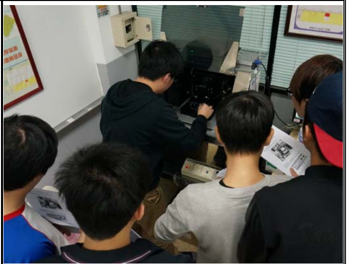
3D表面輪廓儀人機控制介面解說