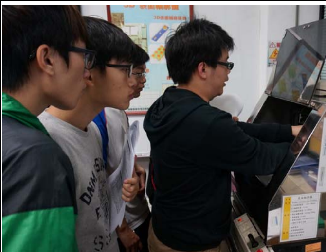
3D表面輪廓儀操作說明