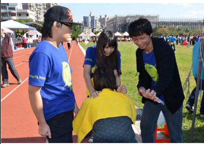
同學間於服務過程中相互交流按摩技術經驗