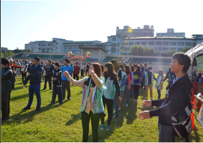
同學搭配活動主題共同參與健身操活動