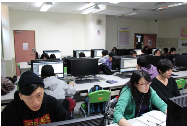
同學認真上課(MIXCRAFT電腦配樂)