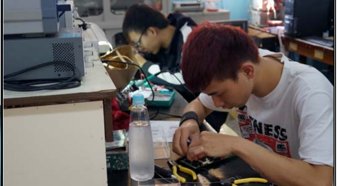
學生們正專注連接電路板