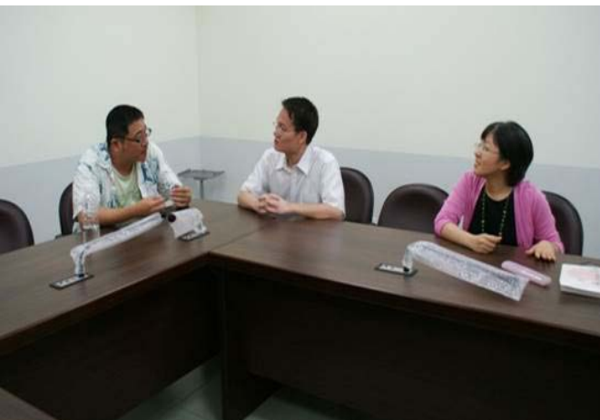
數位系社群討論PBL應用於創意課程教學設計