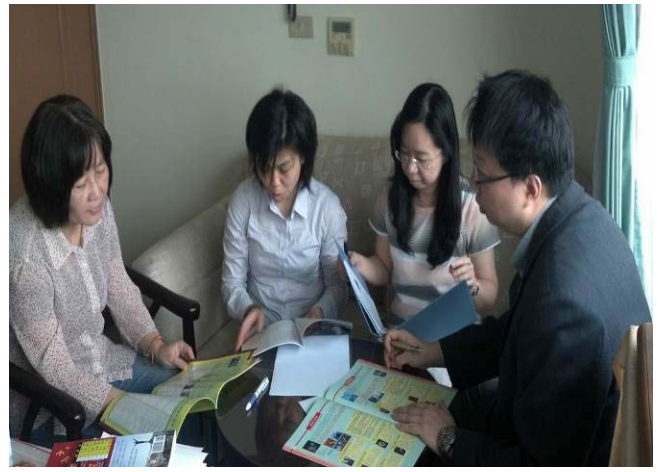
國商系社群討論國際品牌之建構與推廣