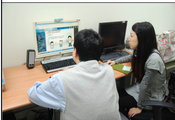
教材設計師與世晉老師討論情形