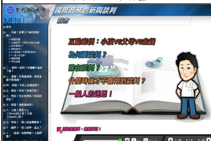
世晉老師數位教材畫面