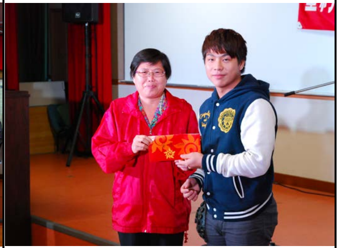
評審老師頒發歌唱比賽第一名