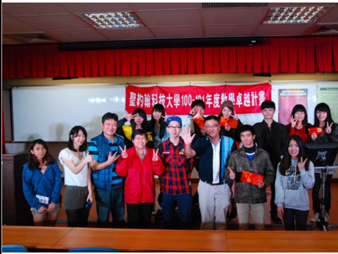
約翰盃英語歌唱比賽同學及師長合照