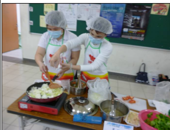
健康便當烹飪比賽—參賽同學烹調情形