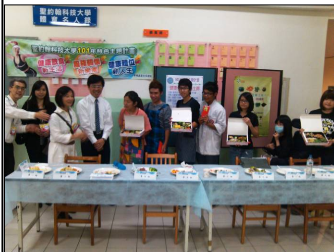
健康便當烹飪比賽—頒獎及得獎作品