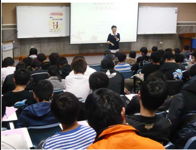
心理衛生講座-人際溝通、自我探索、情緒管理