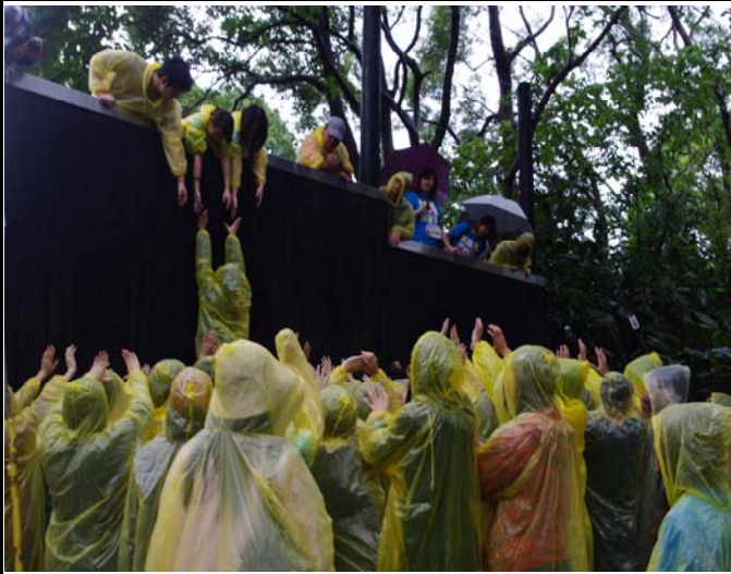
四校同儕體驗教育活動-爬高牆