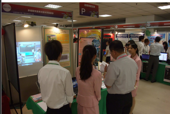
參賽同學與評審委員