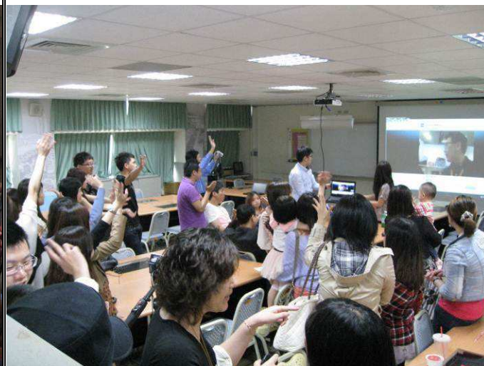
系友們與正在香港參展的老師們連線(二)