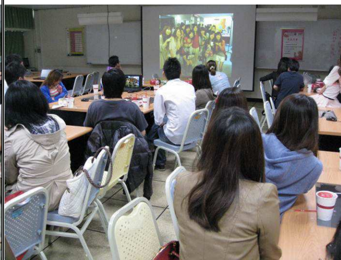
系友們回顧在聖約翰的美好時光