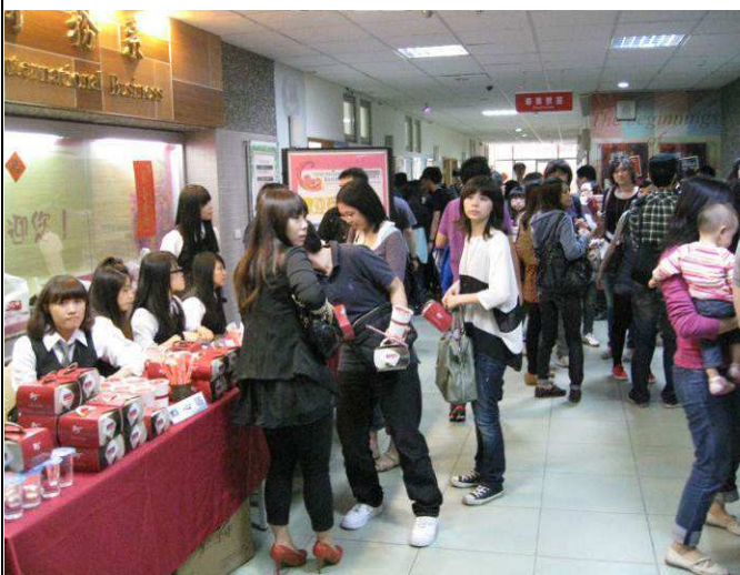
返校系友人潮洶湧