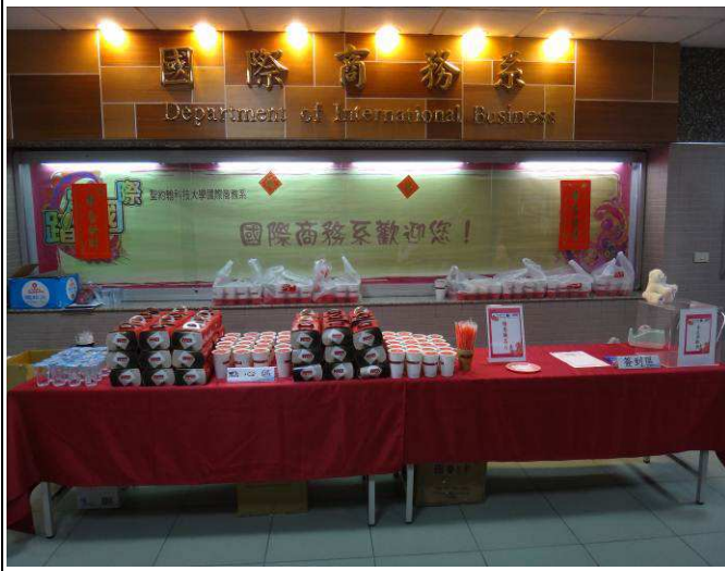
會場外擺設茶點，期待系友們到來