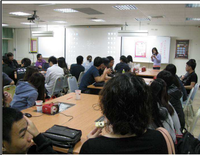
系友們都很開心再見到老師