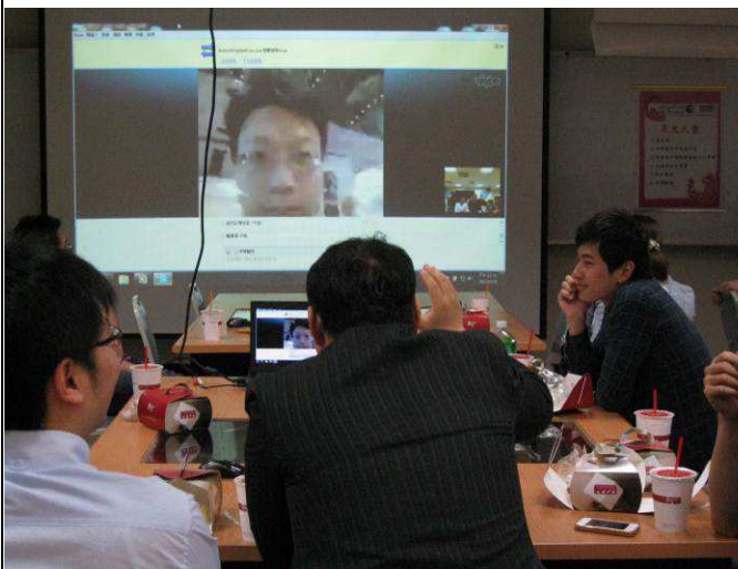
系友們與正在香港參展的老師們連線(一)